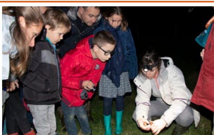
Le 25 mars, les familles ont profité d'une sortie nocturne au plan d'eau des Lavandières pour rencontrer ses habitants insomniaques.