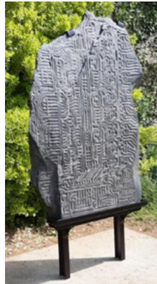
« MESSAGE » de Fabrice Bureau

Une série de panneaux, comme celle présentant les arbres du parc, guidera les visiteurs à la découverte des sculptures. Pour divertir les familles, la municipalité a mis en place une balade ludique sur l'application « Baludik » sous forme de jeu de piste. Pour mener l'enquête, il suffit de télécharger l'application Baludik depuis son smartphone et de lancer la balade « Les Arts en chemin ». Les promeneurs, en réussissant les missions, déclencheront l'affichage de nouvelles informations sur les sculptures. En complément, un livret détaillant chaque œuvre est disponible dans les mairies déléguées ou en téléchargement sur beaupreauenmauges.fr > rubrique Découvrir et sortir.