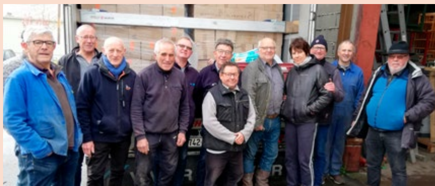
L'association peut compter sur la mobilisation des bénévoles pour préparer les envois de dons en Ukraine.

L'argent collecté va également aider les familles ukrainiennes arrivées, la plupart du temps, avec peu d'effets personnels et peu d'argent, et les familles françaises qui les accueillent, les nourrissent et les habillent. Anjou-L'viv poursuit également ses actions sur place, à l'ouest du pays. L'association soutient notamment l'hôpital pédiatrique de L'viv et quatre orphelinats. Cette aide est d'autant plus précieuse à l'heure actuelle puisque les orphelinats de l'ouest de l'Ukraine prennent désormais en charge les orphelins venant du front des combats à l'est. Ensuite, il faudra aussi participer à la reconstruction.