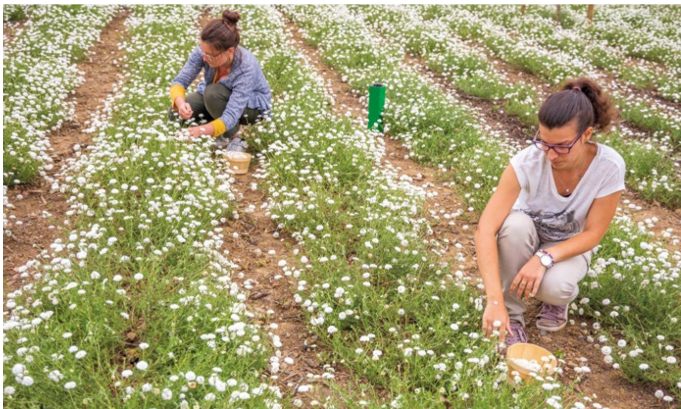
Camomille romaine au Jardin Camifolia

On peut rencontrer la camomille fleurie en juillet-août, tous les vendredis, au jardin Camifolia où des cueillettes sont organisées. ».