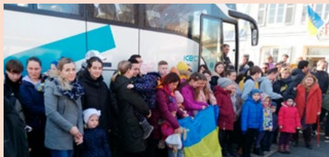
L'arrivée des familles ukrainiennes en bus.

Mi-avril, déjà 9 bus sont arrivés dans les différentes antennes françaises de l'association. À leur bord, on compte 40 à 50 personnes par voyage, toutes accueillies dans des familles françaises. Ainsi, 12 familles ont trouvé refuge dans les Mauges dont 5 à Beaupréau-en-Mauges. Chaque bus est reparti chargé de produits et matériel. De plus, les différentes collectes ont permis d'envoyer 4 semi-remorques en Ukraine via la Pologne ou la Roumanie. Ces voyages sont financés par les dons. À titre d'exemple, un aller-retour en bus de L'viv jusqu'en France coûte environ 8 000 €. En complément, des villes ou des entreprises participent au financement de ces voyages.