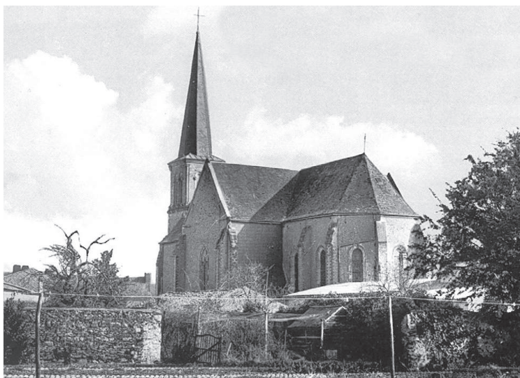
L'ancienne église, construite en 1852

L'histoire raconte que 3 jours après l'incendie de 1794, les rescapés des massacres aperçoivent au milieu des décombres fumants, la statue de la Vierge, noire de suie. Étonnement, les rubans que tenait la Vierge entre ses