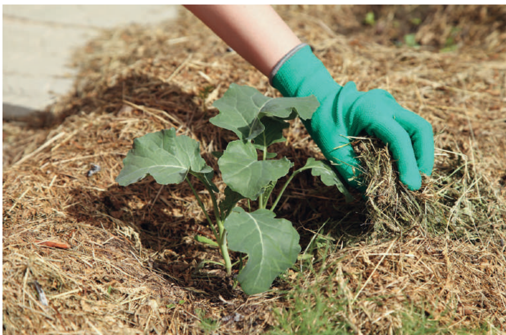
Le paillage est l'une des techniques pour réutiliser facilement vos déchets verts directement dans votre jardin.

Les déchets verts nourrissent la terre : grâce à ces techniques, rien ne se perd tout se transforme !