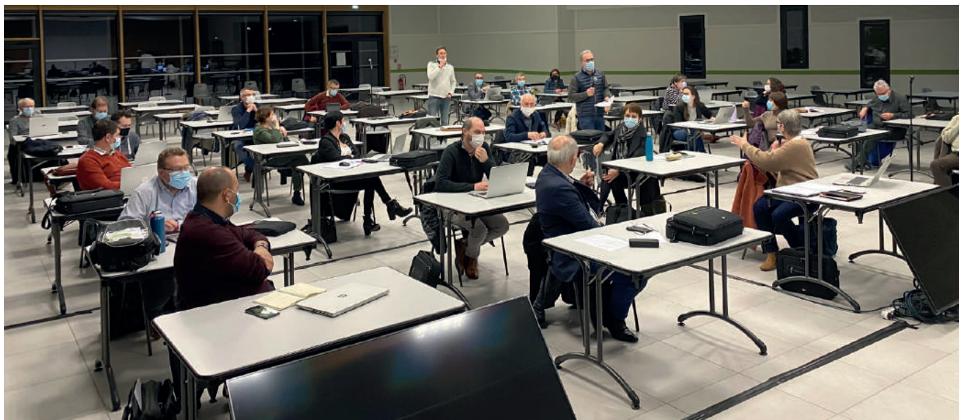
Les élus ont plaché sur l'écriture de la feuille de route du mandat.

AFIN DE METTRE EN ŒUVRE SON PROJET POLITIQUE, LA MUNICIPALITÉ A ÉLABORÉ SA FEUILLE DE ROUTE. APRÈS DE NOMBREUX ÉCHANGES ET ARBITRAGES, CE DOCUMENT DE RÉFÉRENCE FORMALISE LA VISION ET LES AMBITIONS DE LA COMMUNE DE BEAUPRÉAU-EN-MAUGES POUR LES ANNÉES À VENIR