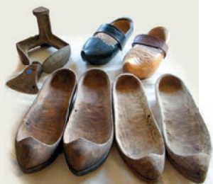
Exposition sur les pas de la chaussure au Pin-en-Mauges

Les visites guidées de Jallais et du château de Piédouault, la balade de QR codes d'Andrezé, les expositions de Beaupréau, Gesté et du Pin-en-Mauges et la séance cinéma proposée à Villedieu-la-Blouère ont également fait le plein et ravi participants et organisateurs.