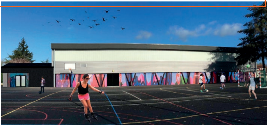
Perspective du futur club-house

Salle du 8 Mai : une extension de la salle est en projet. Ce lieu de convivialité, d'environ 60 m 2 , accueillera le futur club-house. Les travaux débuteront en janvier pour une durée de 4 mois environ. La salle de sport restera accessible.