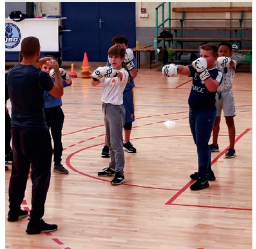
En octobre, une dizaine d'enfants a découvert la boxe éducative.

service des sports au 02 41 71 76 80 ou f.terrien@beaupreauenmauges.fr