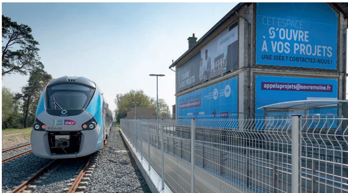
Gare de Torfou

Mauges Communauté doit relever le défi des mobilités sur un territoire rural dynamique, connecté aux territoires voisins, en construisant un réseau de services adaptés pour tous les publics, en coopération avec celui de la Région Pays de la Loire.