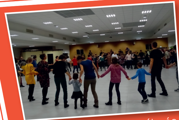
Une scène (8 m x 4 m) surélevée de 80 cm