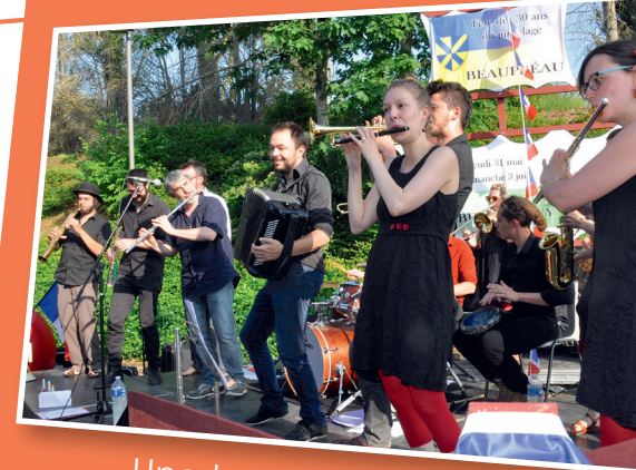
Une terrasse clôturée