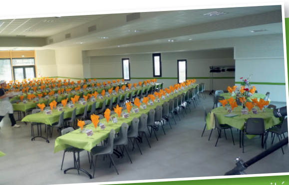
Une grande salle avec une capacité de 400 personnes en conférence et en configuration repas

Moderne et conviviale, la salle de La Prée s'adapte à tous vos besoins. Modulaire grâce à des claustras mobiles et acoustiques, elle peut former un espace de 500 m 2 .