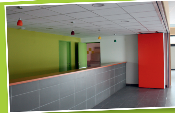
Un espace bar attendant à la salle